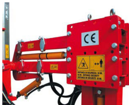
Система бічного висування та нахилу ріжучої рами