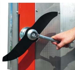
Сменные рабочие органы