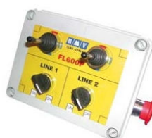
Электрический гидрораспределитель (опция)