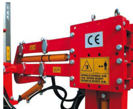
Система бокового выдвижения и наклона режущей рамы