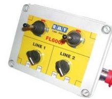
Електро-гідравлічне керування (опція)