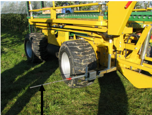
Щуп системы автоматического управления

В качестве опции предлагается компрессор для работы с пневматическими секаторами, возможно подключение до 6 секаторов.