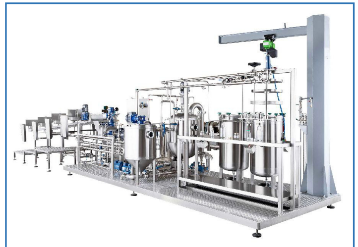
Міні-лінії для переробки фруктів на соки, пюре, концентрати та інші види готової продукції

За вашим запитом ми зможемо підібрати оптимальне обладнання для переробки врожаю на різні види готової продукції, включно з сублімаційною сушкою, шоківим заморожуванням за технологією IQF, для інших видів переробки.