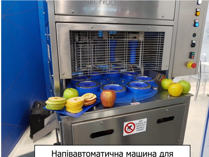
Напівавтоматична машина для видалення серцевини та нарізання яблук на кільця

ТОВ «Агρόстар» пропонує різноманітне обладнання для чищення, видалення серцевини, нарізання, сушіння та переробки фруктів та ягід виробництва провідних фірм Італії