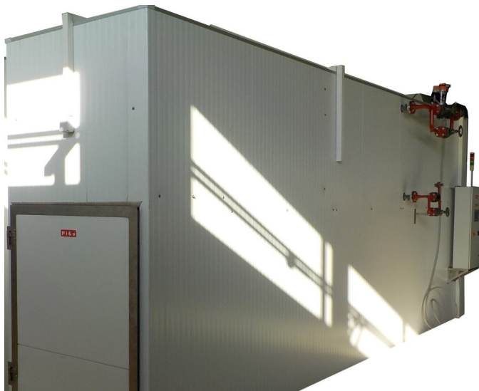
Тунельна сушарка для фруктів (наприклад для виробництва яблучних чіпсів) та іншої сировини