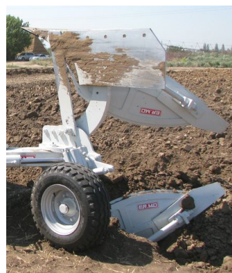
Обертове опорне колесо